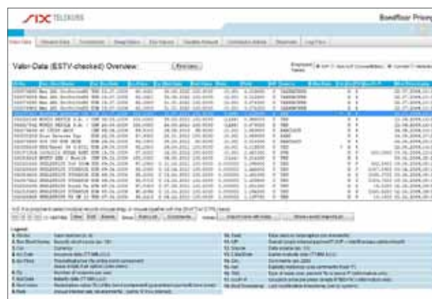
Plate-forme du Bondfloor Pricing Service : une présentation claire des instruments.

La page d'accueil du Bondfloor Pricing Service donne un aperçu de toutes les données clés et des caractéristiques des instruments financiers. Les données clés et les taux de Swap affichés permettent de calculer les valeurs fiscales.